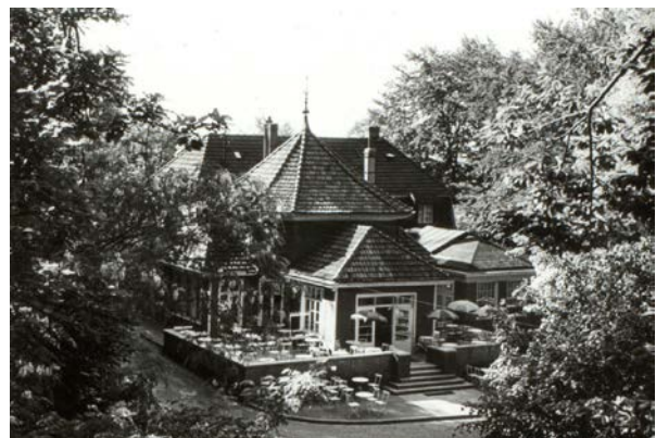
Der Holzpavillon vor dem Umbau.