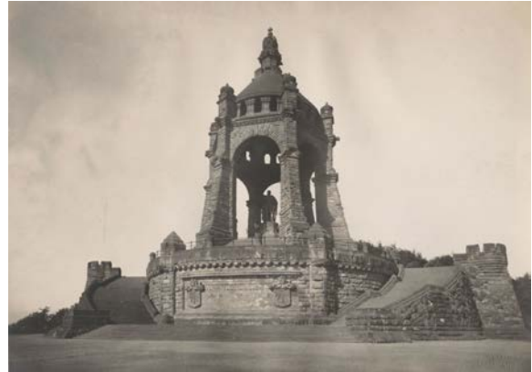
Das Kaiser-Wilhelm-Denkmal am Tor zu Westfalen

Die Zahl der Sitzplätze stieg von 201 auf 214 im Innenbereich, für die Terrasse waren insgesamt 154 Plätze vorgesehen. Für die Umbaukosten wurden einschließlich der technischen Neuausstattung mit Lüftungs- und Heizungsanlage 328.000 DM veranschlagt. Nach der Sommersaison 1965 konnten die Abriss- und Umbauarbeiten am 18. November beginnen. Um sicherzustellen, dass das Gebäude unabhängig von der Witterung spätestens zum Sommer 1966 wieder benutzbar sein konnte, errichtete man ein beheiztes Schutzgebäude aus Holz und Kunststoffolie um den Bau herum. So konnte die Gaststätte am 13. Juni 1966 vom damaligen Pressechef des LWL, Clemens Herbermann, und Landesrat Friedrich Röhrs feierlich wiedereröffnet werden. Dabei wurde rückblickend an die großen Festlichkeiten zur ersten Einweihung des Denkmals durch den damaligen Kaiser Wilhelm II. und seine Frau Auguste Viktoria erinnert. Tradiert ist, dass der Kaiser zu den Klängen eines imposanten Posaunenheeres von 700 Männern den Westfalen ein „Hurra!“ auf das Denkmal zurief, dass sie seinem Großvater gesetzt hatten. Im Vergleich zu dieser prachtvollen Einweihung lief die Wiedereröffnung der Gaststätte in wesentlich bescheidenerem Rahmen ab.