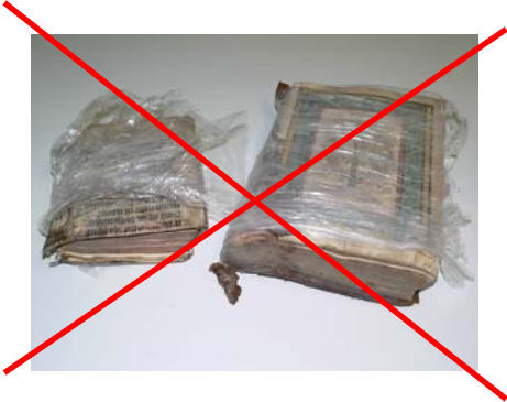
Deformierung des Buchblocks, schlechte Umwicklung