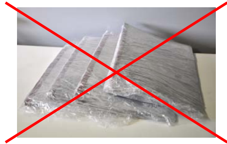
Verpackung von Einzelstücken, Zusammendrücken oder Umschlagen der Folie an den Seiten